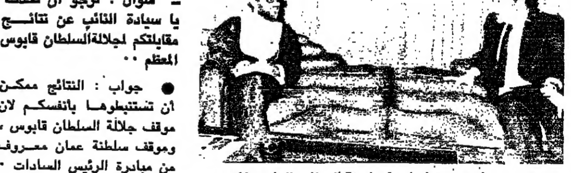
سمو السيد تويتي بن شهاب في استقبال نائب الرئيس المصري

من صباح أمس وقد شهد سمو السيد تويتي بن شهاب المستشار الخاص لجلالة سلطان البلاد المعظم وسعادة يوسف العلوي عبد الله وكيل وزارة الخارجية وسعادة بن سعود سفير سلطنة عمان المعتمد لدى جمهورية مصر العربية والسيد عز الدين مختار الأمين الاول برئاسة الجمهورية والنكتور اسامة الباز مدير مكتب نائب رئيس جمهورية مصر العربية للشؤون السياسية.